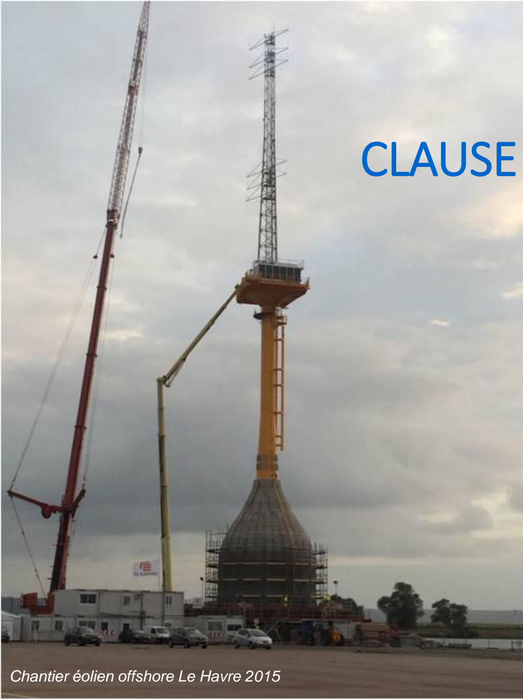
Chantier éolien offshore Le Havre 2015