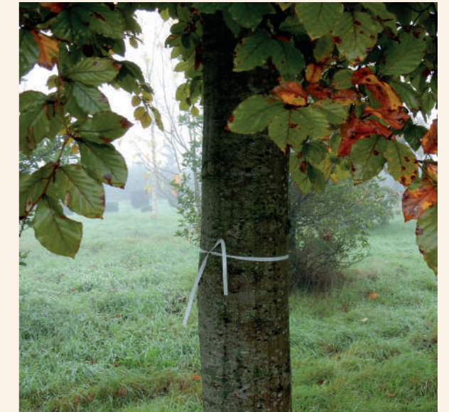
Marquage en pépinière